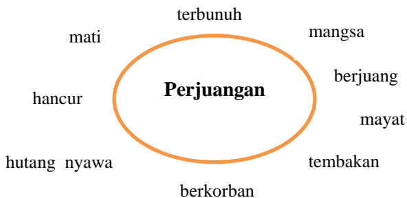
Rajah 2: Kata kunci berdasarkan konsep perjuangan

Kata kunci yang ditemukan dalam novel Perjuangan tertera dalam Rajah 2 di bawah ini: