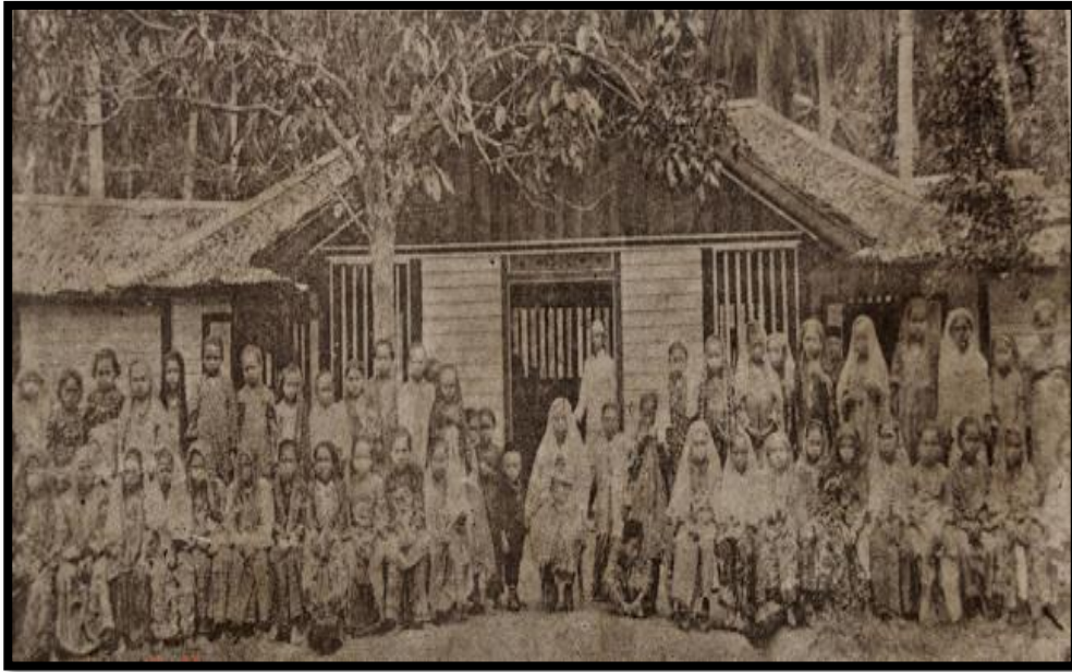
Gambar 2. Sekolah Perempuan di Kuala Langat.