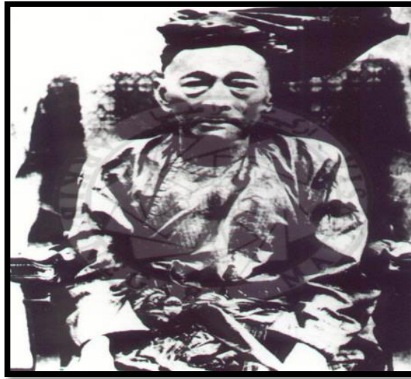
Gambar 1. Sultan Abdul Samad yang juga dikenali sebagai 'Marhum Jugra'.

Secara amnya, tempoh pemerintahan Sultan Abdul Samad di Selangor boleh ditinjau dari tiga tahap.