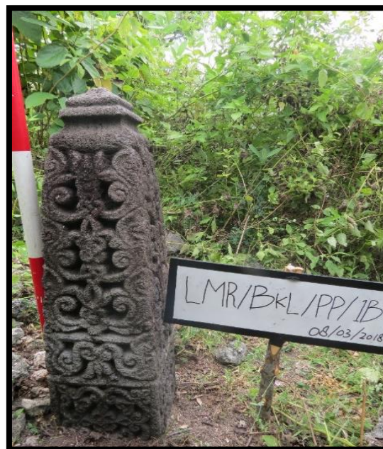
Foto 1. Salah satu batu nisan Plak Pleng di wilayah Banteng Kuta Lubuk (Sel 1)

Terdapat empat buah batu nisan Plak Pleng di wilayah Banteng Kuta Lubuk. Batu nisan ini mempunyai ukuran tinggi 80 cm, bahagian bawah nisan berbentuk segi empat sama ukuran lebar sisi 18x18 cm. Pada satu sisi bahagian kaki nisan paling bawah terdapat ukiran inskripsi kaligrafi dengan menggunakan khat naskhi (Foto 3). Manakala pada sisi lainnya terdapat ukiran bunga. Pada bahagian badan atas nisan dijumpai ornamen flora dan geometri spiral berbentuk huruf S yang diletakkan berlawanan arah. Selanjutnya corak flora atau bungoeng awan sitangke dibahagian badan nisan sejajar dalam empat tingkat. Saluran-saluran bunga juga menghiasi bahagian badan nisan. Seterusnya kepala nisan memiliki dua buah tingkat menyerupai stupa atau lingga.