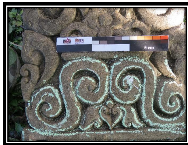
Foto 8 : Corak ukiran geometris spiral yang sudah digayakan membentuk Kalamakara