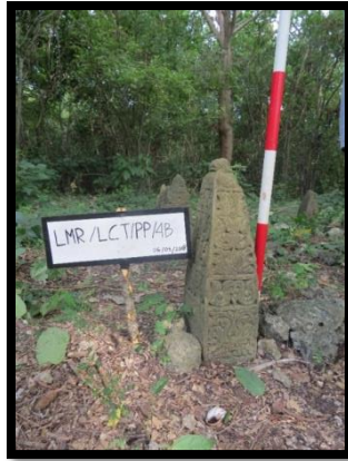
Foto 4: Salah satu batu nisan Plak Pleng di wilayah Lhok Cut (SEL 2)