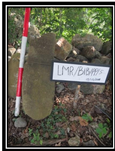
Foto 6: Salah satu batu nisan Plak Pleng di wilayah Benteng Inong Balee (SEL 3).

Batu nisan Plak Pleng di wilayah Benteng Inong Balee berjumlah 5 buah. Namun hanya sebuah sahaja dalam keadaan masih utuh dan insitu . Nisan Plak Pleng di wilayah ini memiliki ukuran tinggi 65 cm. Ukuran sisi bahagian bawah nisan 18 cm manakala sisi yang lainnya berukuran 20 cm. Pada bahagian badan nisan terdapat ukiran kaligrafi dengan menggunakan khat naskhi manakala pada sisi lainnya memiliki ukiran bunga teratai. Pada bahagian atas nisan telah patah hanya tinggal bahagian kaki dan badan sahaja.