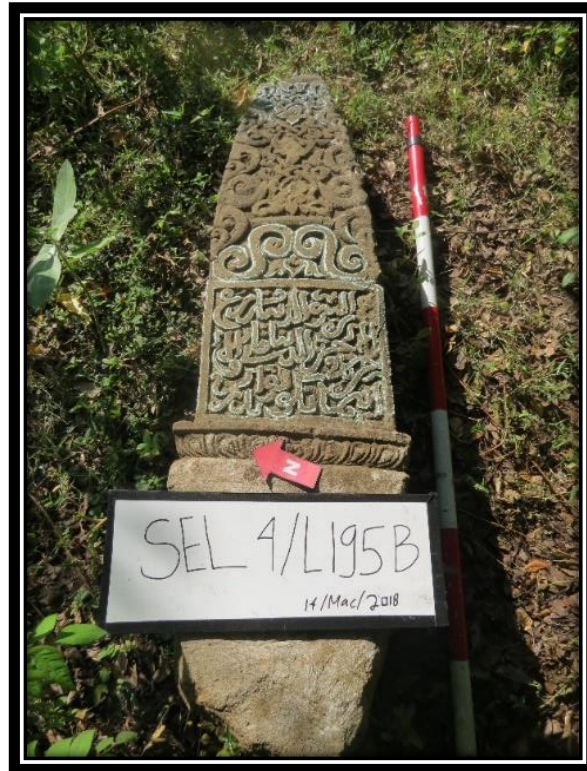
Foto 7: Salah satu batu nisan Plak Pleng di wilayah Makam Sirajul Muluk (SEL 4).

Nisan Plak Pleng yang dijumpai di wilayah Makam Sirajul Muluk hanya mempunyai dua buah batu nisan sahaja. Keadaannya telah roboh dan tidak dijumpai secara insitu . Nisan ini berukuran besar dengan tinggi 100 cm. Bahagian kaki nisan berbentuk segi empat sama semakin ke atas semakin tirus dengan berukuran 25x25 cm. Ornamen atau hiasan yang terpahat pada nisan ini lebih rumit (Foto 4). Bahagian badan bawah dihiasi dengan kaligrafi khat naskhi. Pada badan bahagian atas dihiasi dengan pahatan geometri spiral huruf S yang saling berhadapan membentuk hiasan Kalamakara. Pahatan ornamen kalamakara yang sudah di gayakan sangat jelas terlihat pada bahagian badan nisan dengan jumlah empat tingkat. Kalamakara merupakan simbol yang sering digunakan pada pintu bangunan candi Hindu dan Buddha seperti Candi Mendut dan Candi Kidal di Jawa Tengah (Halim 2017: 23). Bahagian kepala nisan ini telah patah.