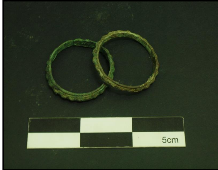
Foto 2. Gelang