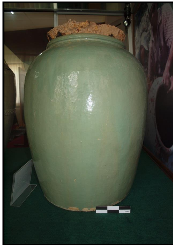
Foto 5. Tjau tanpa ukiran

Mulut tjau akan ditutup dengan menggunakan gong kecil atau penutup khasnya (Foto 6). Di sekeliling penutup tersebut dilekatkan atau dibalut dengan 'sempilut' sejenis sarang lebah kecil bagi