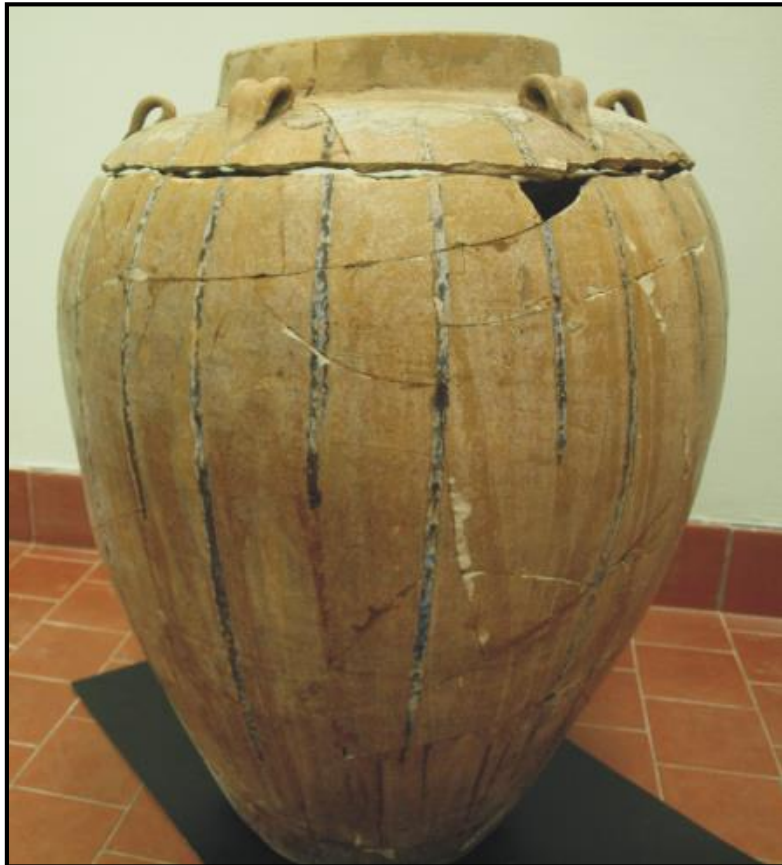
Foto 1. Bahagian tajau yang dipotong bagi memudahkan proses memasukkan mayat

wanita mudah dimasuki oleh roh untuk memberitahu apa yang dikehendaki oleh roh-roh yang dipanggil oleh mereka. Komburongoh merupakan alat yang digunakan oleh bobolian untuk berhubung dengan roh-roh jahat. Bobolian akan membaca 'renait' atau jampi mantera untuk memohon restu kepada Kinorhingan supaya perjalanan roh si mati selamat. Mayat si mati akan dimandikan dan dipakaikan dengan pakaian yang cantik. Setelah selesai 'renait', barulah mayat tersebut dimasukkan ke dalam tajau. Bagi memudahkan mayat si mati dimasukkan ke dalam tajau, bahagian tengah tajau akan dipotong (Foto 1). Kedudukan si mati di dalam tajau tidak diambil kira, asalkan si mati tersebut boleh masuk ke dalam tajau tersebut. Berlainan keadaan mayat yang dijumpai di Indonesia, keadaan mayat dalam tempayan besar adalah dalam kedudukan berlipat ( flexed position ) (Satyawati Suleiman 1980).