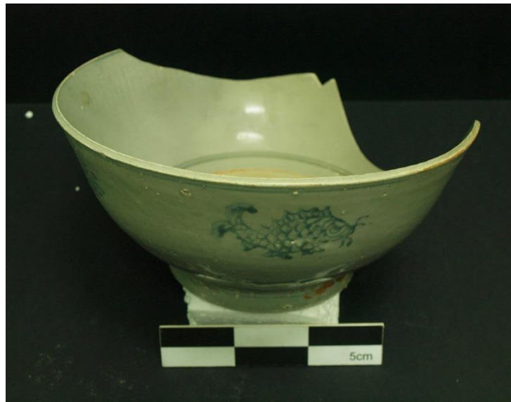
Foto 3. Mangkuk Seramik