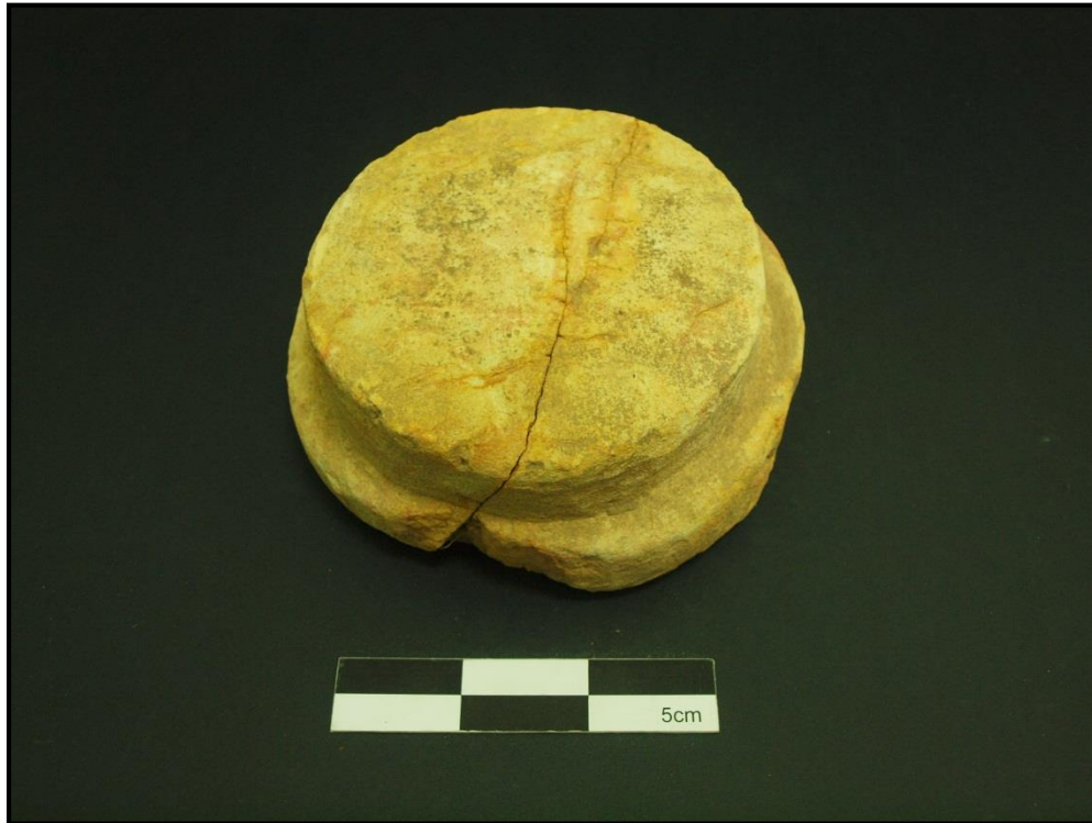
Foto 6. Penutup tajau