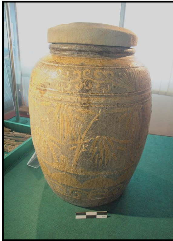
Foto 4. Jenis tjau yang bercorak